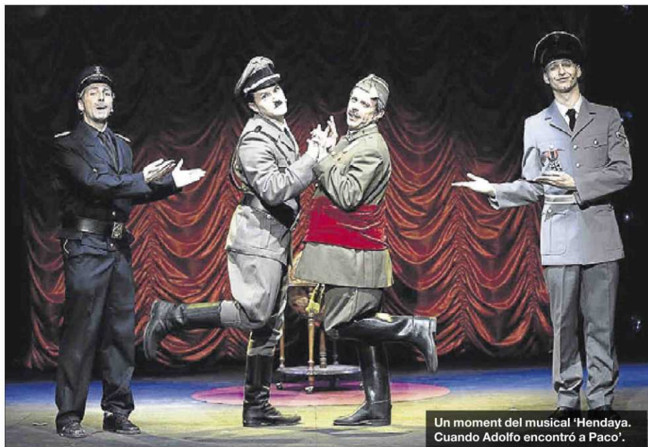
Un moment del musical 'Hendaya. Cuando Adolfo encontró a Paco'.