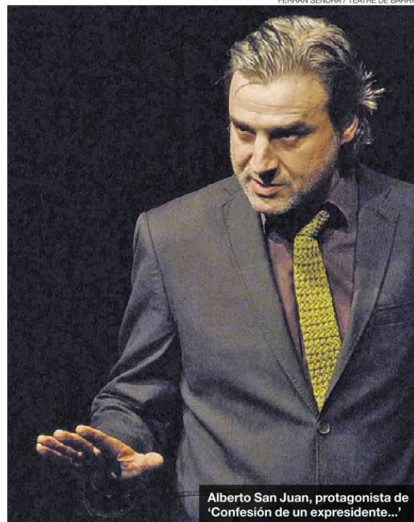
Alberto San Juan, protagonista de 'Confesión de un expresidente...'