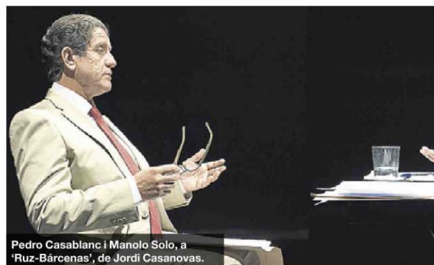
Pedro Casablanc i Manolo Solo, a 'Ruz-Bárcenas', de Jordi Casanovas.